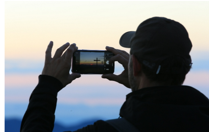
März: Sonnenaufgang auf dem Belchengipfel (W. Steiger)