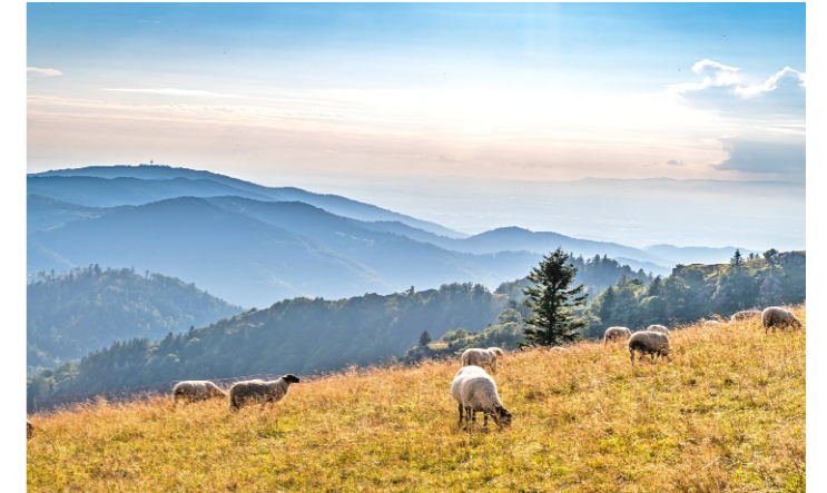
August: Schafherde am Belchen (K. Hansen)