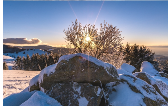
Februar: Der Schauinsland, links der Belchen (K. Hansen)