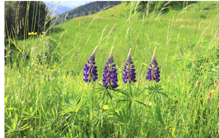
Juni: Lupinen in Fröhnd (W. Steiger)