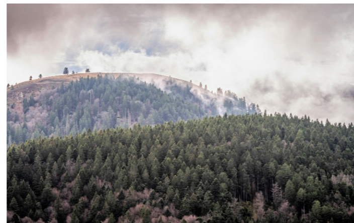
Oktober: Herbststimmung am Belchen (K. Hansen)