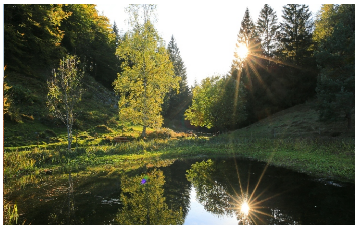
September: Morgenstimmung am Letzbergweiher (W. Steiger)