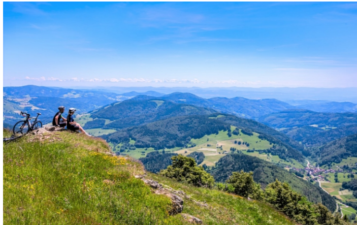
Mai: Radfahrer am Belchen (K. Hansen)