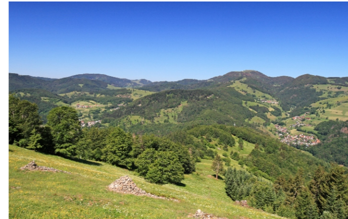
Juli: Der Zweistädteblick (W. Steiger)