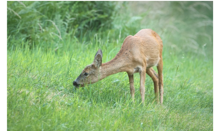
April: Hungrige Ricke nach dem Winter (W. Steiger)