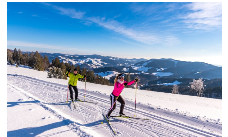
Dezember: Langläufer auf der Tonispur (K. Hansen)