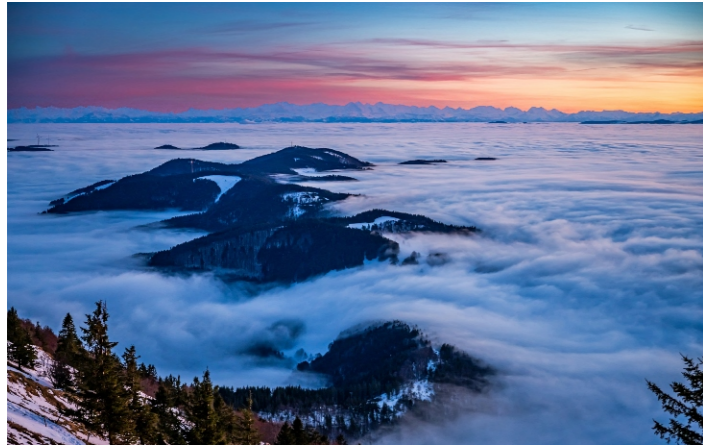
Januar: Sonnenuntergang vom Belchen (K. Hansen)